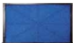
RCX70103 Filtre démarrage saison