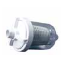
Pièges à feuille