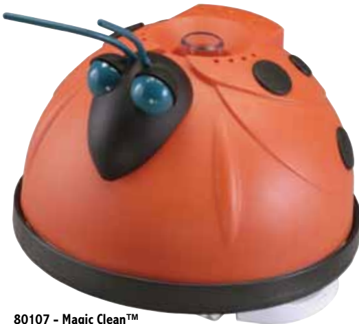
80107 - Magic Clean™