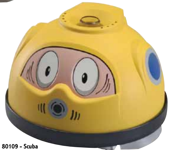
80109 - Scuba