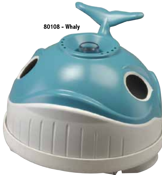
80108 - Whaly