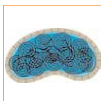
Système de guidage automatique