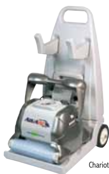
Chariot de transport inclus